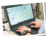
緊急情報放送用ノートパソコン