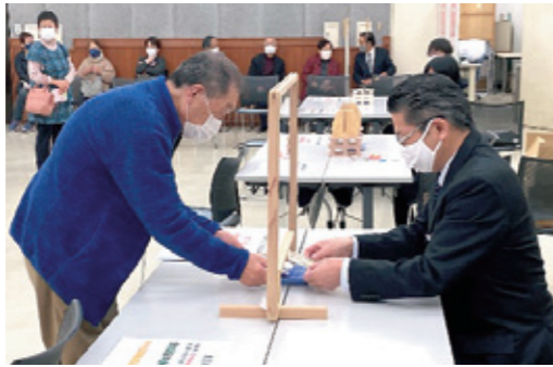
ソーシャルディスタンスを保つための販売会場