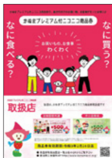
このポスターが目印