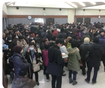
● 昨年、超満員の販売会場

■平成16年にスタートした鹿沼商工会議所の共通商品券事業は通年の発行に加え、当所の要望で市の補助により、プレミアム付き商品券を発行しています。 ■今年のプレミアム付き商品券の発行は、鹿沼市制70周年を記念し、昨年の倍の発行を予定しております。