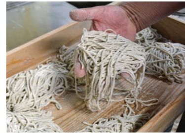
●コシがあり風味豊かな青竹打ちのそば

ながら静かな時間が過ごせます。そばは、「この水との合いがなければそば店はやっていない」と店主が話すこだわりの岩清水を用い、自らの手で脱皮自家製粉した100%鹿沼産のそばを青竹打ちで仕上げます。そばを茹でる水も、茹で上げた後にギュッと風味を閉じ込める掛水も、使用するのは、豊富な岩清水。コシが強く風味豊かなそばと、天然素材のみで仕込んだ旨味のあるつゆとの相性も抜群です。