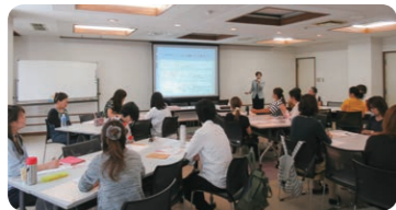
●プチ起業講座 受講風景