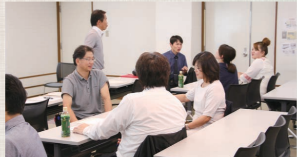
コミュニケーションの大切さを実感

コミュニケーションが変われば、仕事もプライベートもうまくいく! という事で、シミュレーション形式で研修をしました。