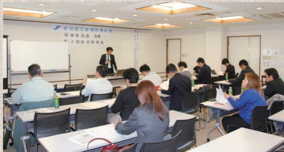
真剣に研修する参加者

会員研修会「お金が見える!お金が増える! どんぶり勘定の磨き方」開催 決算書の見るポイントを学び、先の経営状況把握について研修しました。