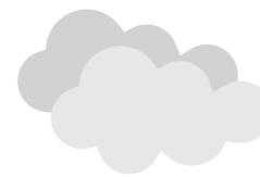
平成29年10月～平成29年12月の景況感(曇り)