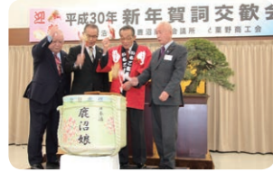
●地酒の鏡割り による新年の 祝い