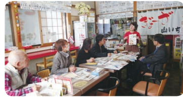
●先輩創業者を訪れ、 体験談を聞く講座も・・・