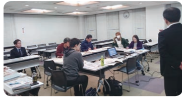
●かぬま創業塾 受講風景