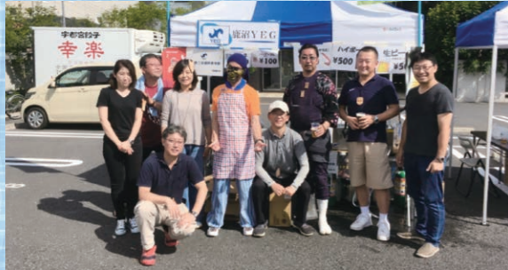
見物客やお祭り若衆の憩いの場所でした!

鹿沼秋まつり 「TAMACHI・ごちゃごちゃCafé」出店 秋まつり2日目に鹿沼秋まつり若衆会様主催により、TAMACHI・ごちゃごちゃCaféに出店し、イベントを盛り上げました。