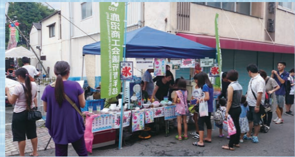
子供に大人気のかき氷!

(一社)鹿沼青年会議所様主催により、30年ぶりに復活した七夕まつりに、かき氷で出店し、イベントを盛り上げました。