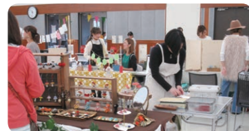
●体験マルシェ 風景

き店舗等活用新規出店支援事業」や店舗の内外装整備や備品購入にも補助が出る「個店整備事業(創業者以外も活用可)」など、鹿沼市の創業者への支援策が、県内他市と比べて、手厚い支援策を提供しているのも創業者が多くなっている1つの要因といえるでしょう。